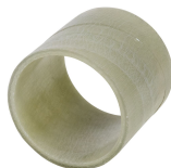
Luva SL GRP