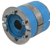
RS BG™ -tiiviste