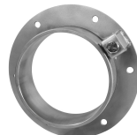
SLF RS BG™-Mantelrohr

Weitere Informationen finden Sie unter www.roxtec.com .