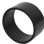
Luva SL RS